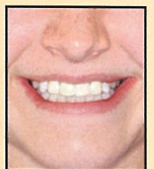
使用後 Perfect Smile!