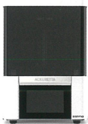
Industrial-grade 3D printers